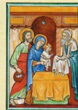
La Présentation de Jésus au Temple la pureté et l'obéissance