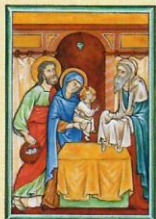
La Présentation de Jésus au Temple la pureté et l'obéissance